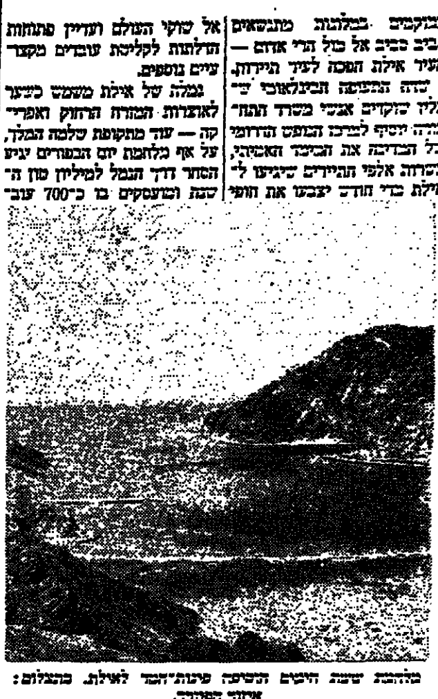
המבט לעתיד... חגיגות ה-25 - ומבט לעתיד

ה-25 להקמת אילת... המבט לעתיד... חגיגות ה-25 - ומבט לעתיד